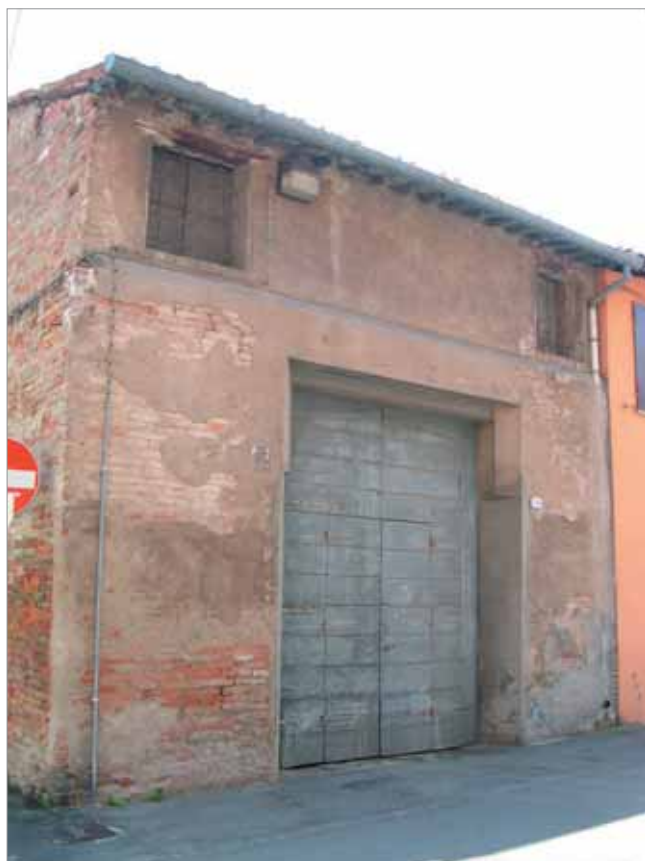
Via Garzoni 39 Fronte Principale